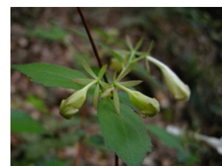
ツクバネウツギの花

名称は「突羽根」と「空木」の組み合わせですが、「突羽根」は萼が羽根突きの羽根を連想させたものです。11月には羽根の下側についた種子が枝先から離れ、おもりとなってクルクル舞いながら落下します。風が吹けば遠くまで種子が散布できるというしくみです。