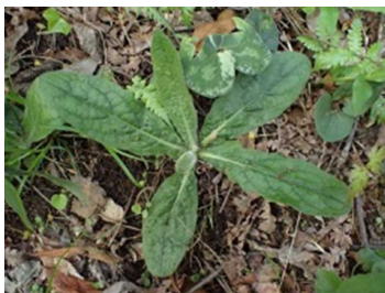
ガンクビソウの根生葉

キク科の多年草です。春の芽出しの時期はあまり特徴がなく、目立たない草ですが、花が咲くと存在感が出てきます。