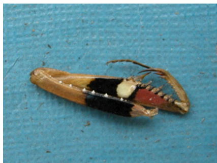
コカマキリの前脚の内側

卵囊(らんのお)は物の面に付ける習性なので、石や壁に張り付けて見つかります。オオカマキリのくし団子型とは産みつける環境が異なるため、探し方も変える必要があります。夜間、灯火へ飛来することもありますので、家の壁で見つかることがあります。卵囊を付ける場所はどのような選択基準があるのでしょうか。オオカマキリが高い場所に付けている年は雪が多いなどといいますが、当てにならないようです。コカマキリはずっと低い位置です。日当たりも関係ありそうです。