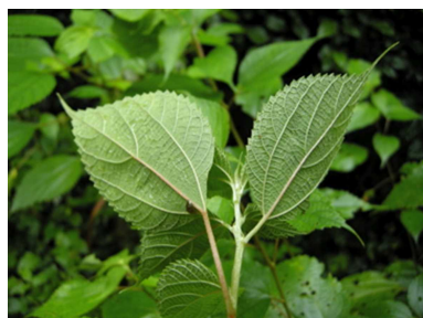
アオカラムシの葉裏