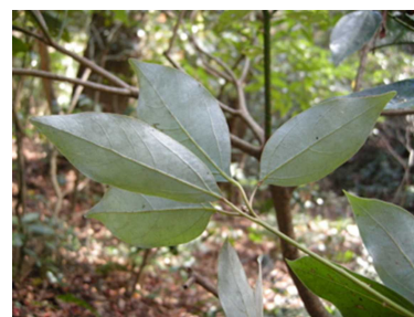
葉裏が白いシロダモの葉

この実にはロウが含まれていて、ロウソクに利用されたとのことですが、栽培はされていません。ハゼは大量の実が入手できる上にロウの質もよいことから栽培され、ハゼ蠟を使用した和ロウソクが作られています。