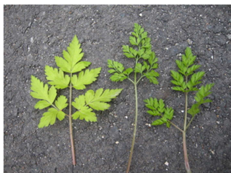
セリ科3種の葉 (左からヤブニンジン・セントウソウ・ヤブジラミ)

が住む仙洞御所の“仙洞”を当てる例もあります。ひっそりと陰に生育するというよりそれなりの光を好むようで、湿気のある山麓の林縁が生育地です。