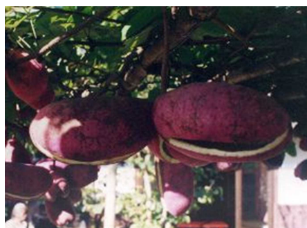
熟したアケビの果実

付けるのは、種子を散布してもらうためです。種子が熟さないうちは緑色で葉の中に隠れている実が、熟すと赤く変わり存在を誇示します。果肉と種子を一緒に食べ、種子を糞として離れた地点に落としてくれる動物が対象です。アリのように甘いところだけを持ち去るものはだめです。動物にとって魅力のある大きな実にしなけりばならなかつた相手は、一口で食べてくれるクマやサルです。ヒヨドリなどの鳥は選り分けて食べるので、よくない相手です。