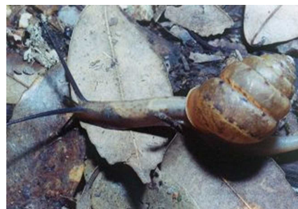
ヤマタカマイマイ

環境省のレッドデータブックでは準絶滅危惧種ですが、鳥取県では指定していません。しかし、個体数が少なく、なかなか