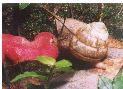
カンゾウタケを食べる ヤマタカマイマイ

出会わない種です。打吹山では初秋に比較的目につくように感じます。理由は、9月中旬以降にシイの大木の根元に生えるカンゾウタケを食べているものがあるからです。赤いカンゾウタケは遊歩道を歩いても目立つため見てしまい、結果ヤマタカマイマイを見つけてしまうのです。