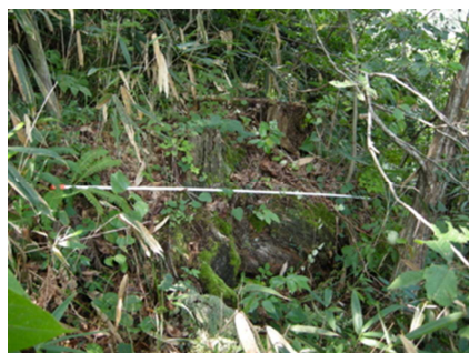
クロマツの切株 (スケールは2m)

今の打吹山にはほとんどマツが見られません。マツクイムシで枯れたのですが、昭和年代には大木もありました。江戸時代の倉吉の町の絵図をみると、打吹山の稜線にはアカマツと思われる木が描かれています。伐採