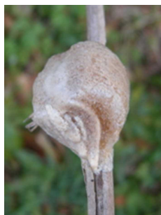
オオカマキリの卵囊

卵を寒さから守るために断熱材で作る卵囊(らのう)は、それぞれの形態に特徴があり、付ける位置も異なります。草本の茎にチマキ型に付けるオオカマキリ、丸太や電柱のような広い平面に小判型に付けるハラビロカマキリ、石面などに逆涙滴型のコカマキリ、枝に同じ形のチョウセンカマキリ、樹皮の裏や石の隙間に小さい小判型のヒメカマキリ(地図中①地点 大江神社狛犬台座下)と卵囊を見れば種がわかります。