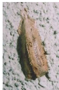
コカマキリの卵囊