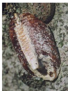
ハラビロカマキリの卵囊