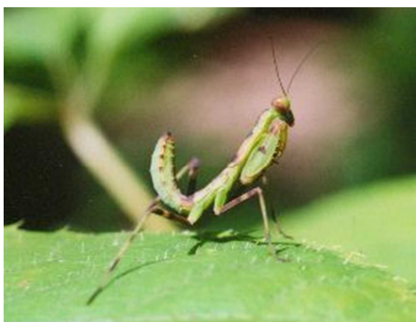
ハラビロカマキリの幼虫

打吹山で確認されているカマキリは、オオカマキリ、ハラビロカマキリ、コカマキリ、ヒメカマキリの4種で、その他に倉吉市内にはチョウセンカマキリ、鳥取県ではウスバカマキリ、ヒナカマキリがいます。森林内の落ち葉の上にいるヒナカマキリは今後発見が期待されます。ヒメカマキリは樹冠にいるため目につきにくく、残りの3種とはよく出会います。