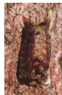
ヒメカマキリの卵囊