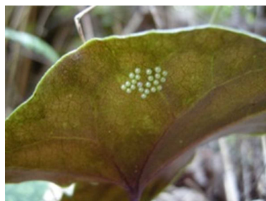
カンアオイの葉裏に産みつけられたギフチョウの卵